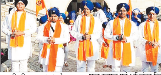
हरिभूमि न्यूज कोरबा

जिले में गुरुद्वारा श्री दुखहरण साहब से सिख समाज द्वारा शहादत दिवस के अवसर पर जुलूस निकाला गया। यह जुलूस गेवरा-दीपिका क्षेत्र से होकर गुजरा, जहाँ सर्व समाज के लोगों ने पुष्प वर्षा कर जुलूस का