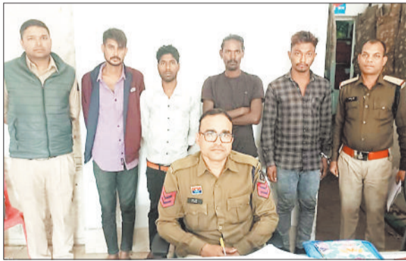
पुलिस गिरफ्तार में वारंटी।

नए साल को लेकर पुलिस अभी से अलर्ट हो गई है। 31 दिसंबर व नए साल में बड़े पैमाने पर लोग जश्न मनाने के लिए सड़कों पर उतरते हैं तो पिकनिक स्पॉटों में भी भारी भीड़ रहती है। इस दौरान पुलिस की चाकचौबंद व्यवस्था रहेगी और अपराधियों पर शकंजा