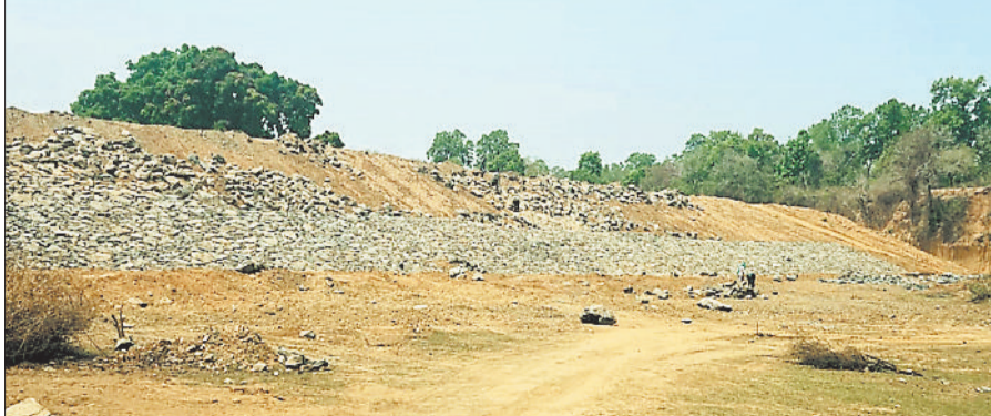
पाथा जलाशय में चल रहा पिचिंग का काम।

बांगो माचाडोली के समीप पाथा जलाशय के जीर्णोद्धार का कार्य किया जा रहा है। 4 करोड़ रुपए की लागत से जलाशय की तस्वीर बदलने का कार्य शुरू किया गया है। इसमें लगे प्रभारी अधिकारियों को हटाने की भी कार्यवाही पहले की गई। जल संसाधन उपसंभाग क्रमांक 2 के अधीन चलने वाले कार्य का प्रभारी अधिकारी उप संभाग क्रमांक 01 के अधिकारियों को बनाया गया है।