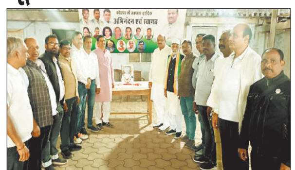
पूर्व प्रधानमंत्री को श्रद्धांजलि देते कांग्रेसी।