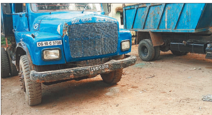
नगर निगम पंप हाउस में खड़े खराब ट्रक।

जबकि जिन गाड़ियों को सुधार की जरूरत है, उसके लिए राशि नहीं होने का बहाना बनाया जा रहा है। इस कारण गाड़ियां पंप हाउस में खड़ी हैं और निजी गाड़ियों का उपयोग काम के लिए किया जा रहा है। इन गाड़ियों के नाम पर भी हजारों की रकम की बंदरबांट हो रही है।