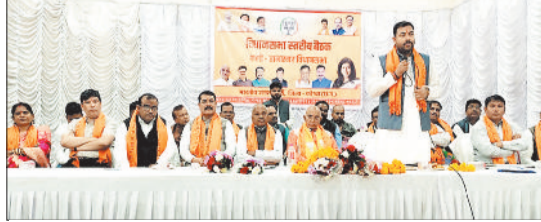
बैठक को संबोधित करते हुए युवा आयोग के अध्यक्ष।