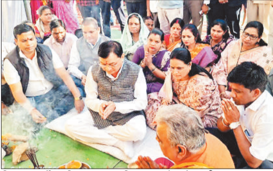
विकास कार्यों का शिलान्यास व भूमिपूजन करते उद्योग मंत्री।

नगर निगम के सर्वमंगला नगर जोनांतर्गत 5 वार्डों को 1 करोड़ 55 लाख रूपये के विकास कार्यों की सौगत प्राप्त हुई। उद्योग, वाणिज्य, श्रम, आबकारी व सार्वजनिक उपक्रम मंत्री लखनलाल देवांगन के मुख्य आतिथ्य एवं महापौर श्रीमती की अध्यक्षता में आयोजित इन विकास कार्यों का भूमिपूजन व लोकार्पण किया गया। इनमें से 1 करोड़ 10 लाख रूपये के विकास कार्यों का भूमिपूजन व 44 लाख 29 हजार रूपये के विकास कार्यों का लोकार्पण सम्पन्न हुआ। इस मौके पर सभापति नूतन सिंह ठाकुर सहित निगम के पार्षदगण, जनप्रतिनिधिगण विशेष रूप से उपस्थित थे।