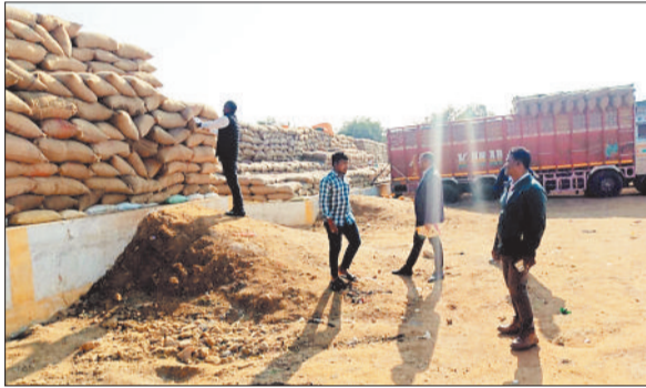
धान उठाव करते हुए समिति प्रबंधक व कर्मचारी।

धान खरीदी के बाद उठाव के लिए राइस मिलर्स से विपणन विभाग के द्वारा अनुबंध किया जाता है और अनुबंधित राइस मिलर्स को उठाव के लिए डीओ काटकर दिया जाता है। धान उठाव के लिए शासन के द्वारा समयावधि भी निर्धारित की गई है। बीते वर्ष शासन के द्वारा समिति से धान उठाव के लिए 10 दिन की अवधि निर्धारित की गई थी। डीओ