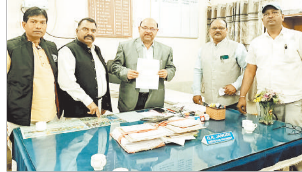
ज्ञापन सौंपते हुए फेडरेशन के पदाधिकारी।

छत्तीसगढ़ कर्मचारी अधिकारी फेडरेशन द्वारा मोदी की गारंटी को अमल में लाने को लेकर 29 से 31 दिसंबर तक तीन दिनों तक कलम बंद काम बंद हड़ताल पर जिले के सभी विभागों के कर्मचारी अधिकारी शामिल होंगे।