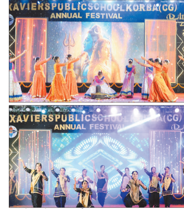
सांस्कृतिक कार्यक्रम प्रस्तुत करती छात्राएं।