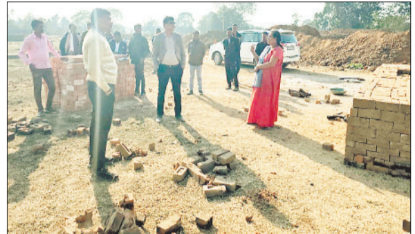
कार्यवाही करती हुई प्रशासनिक टीम।