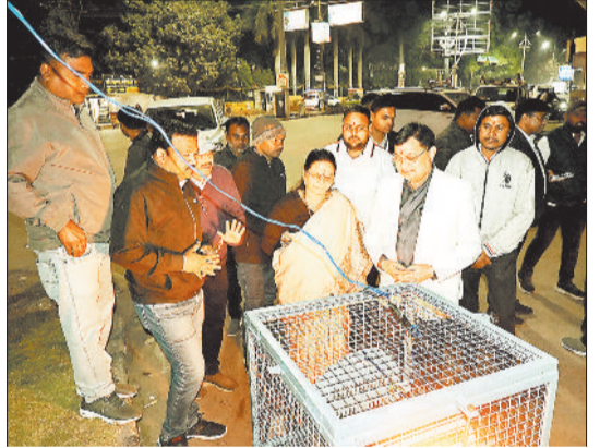
लोकार्पण करते उद्योग मंत्री एवं महापौर।